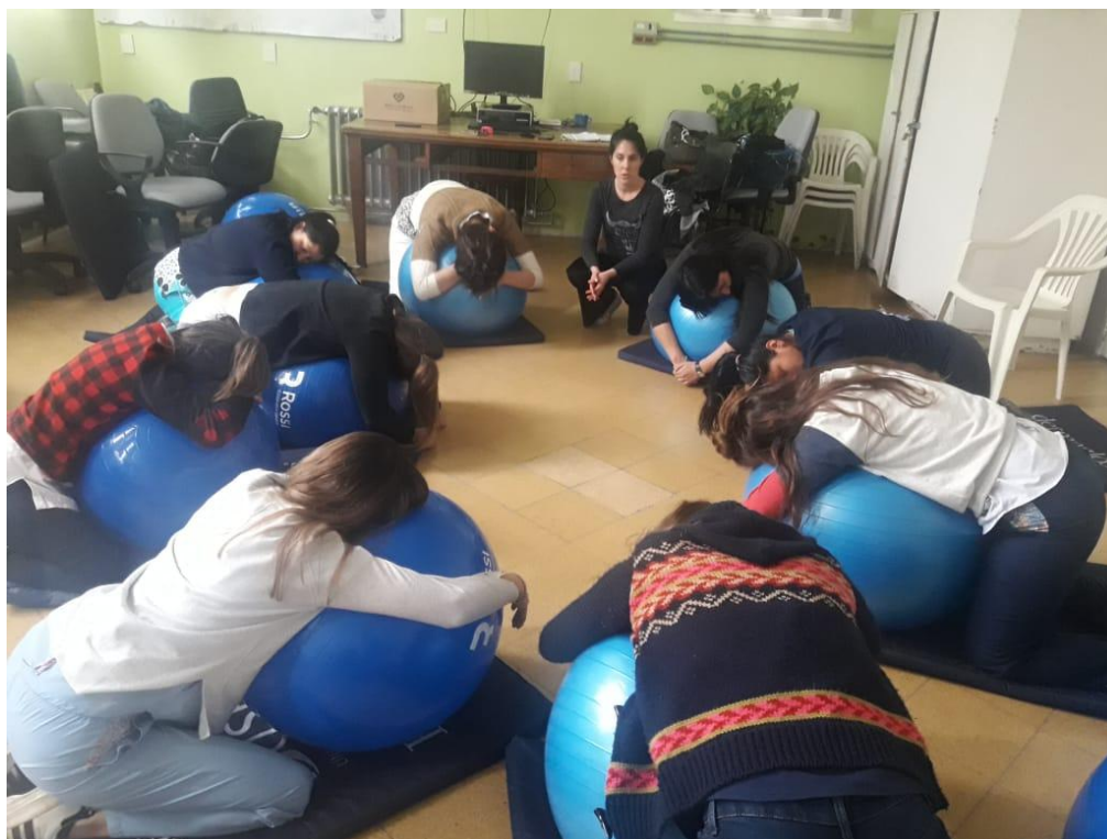
Foto 1. Actividad con esferas en el marco del curso de Preparación Integral para la Maternidad.

7.3. Charlas de educación sexual y reproductiva en residencia de madres en junto con el equipo de Salud Mental, bajo el formato del juego “Preguntados”, trabajamos mitos e informamos sobre métodos anticonceptivos. A estas mujeres se les otorga turnos prioritarios para consultorio de Planificación Familiar. Dicha actividad no es comparable con los datos de la División Estadística ya que no cuentan con este registro.