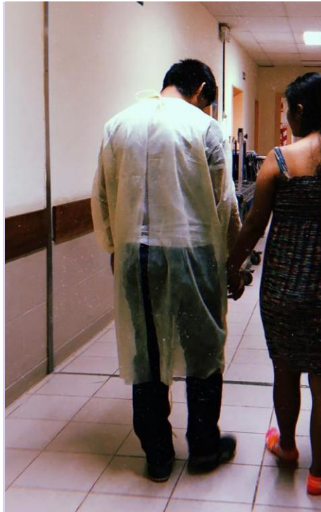
Foto 2. Semana del Parto respetado- Ley 25929 acompañamiento durante el trabajo de parto y libre deambulacion en embarazos de bajo riesgo.

de folletos informativos, se prepararon powerpoints brindando consejería y apoyo a la Lactancia Materna, juegos de interacción, sorteos y regalos a los presentes. (Foto N°2)